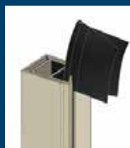
SISTEMA PIOLA GUIADA

Ziptrak® se fabrican a la medida de tus necesidades, para una instalación segura y sin problemas. El sistema puede cubrir amplios espacios para reducir la necesidad de soportes verticales adicionales, y proporcionar vistas ininterrumpidas.